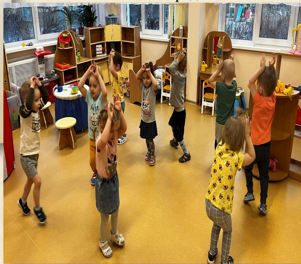
Физкультминутка: «Заячья зарядка»