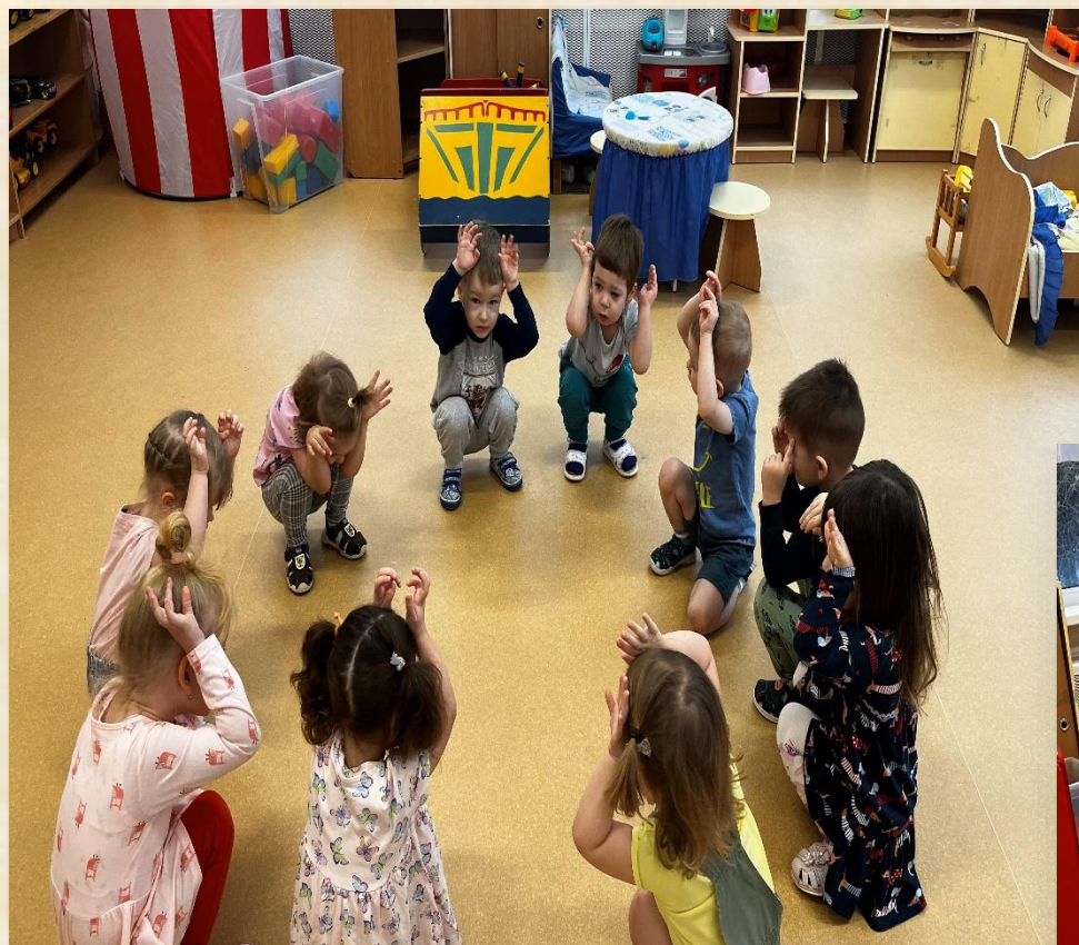
Хороводная игра: «Зайка серенький сидит»