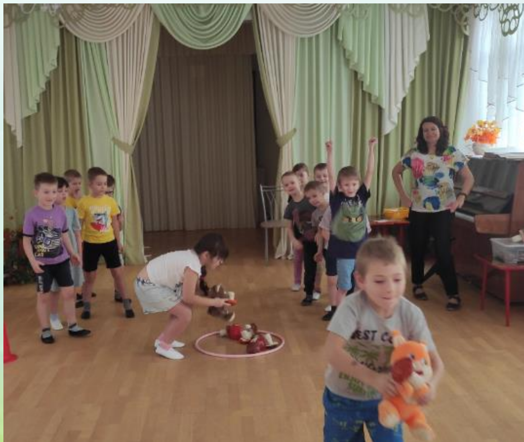
Музыкальная игра: «Что в лукошко мы берем»