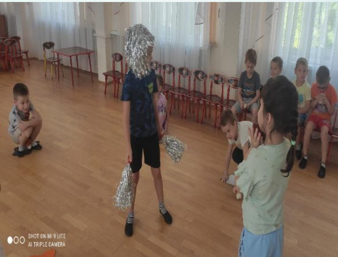
Подвижная игра: «Дождь идет и гриб растет»