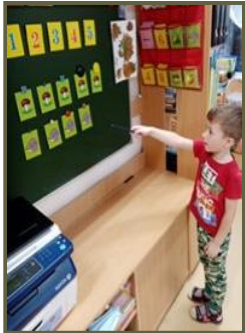
Дидактическая игра: «Посчитай припасы у ежа»