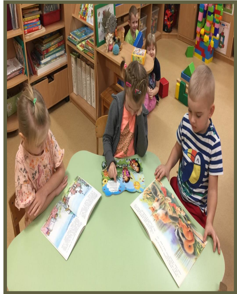
Рассматривание иллюстраций: «Ежи»