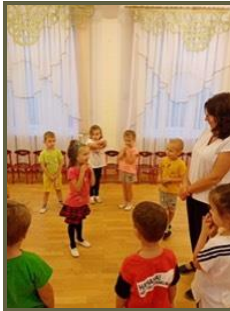
Музыкальная игра: «Ау, ежик»