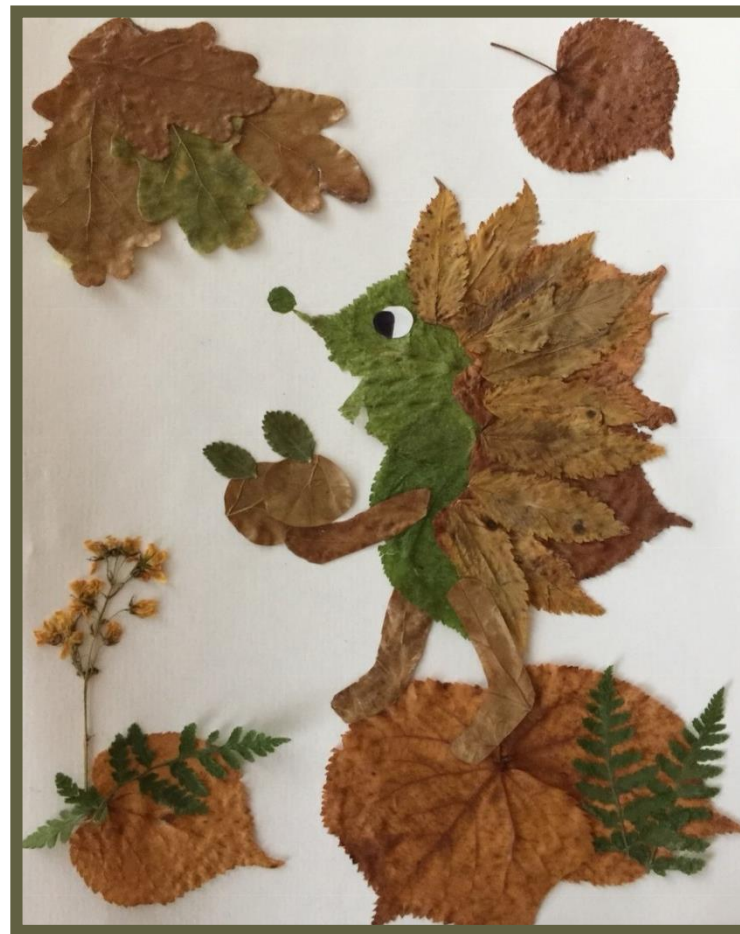
Работа семьи: Батыр Ирины