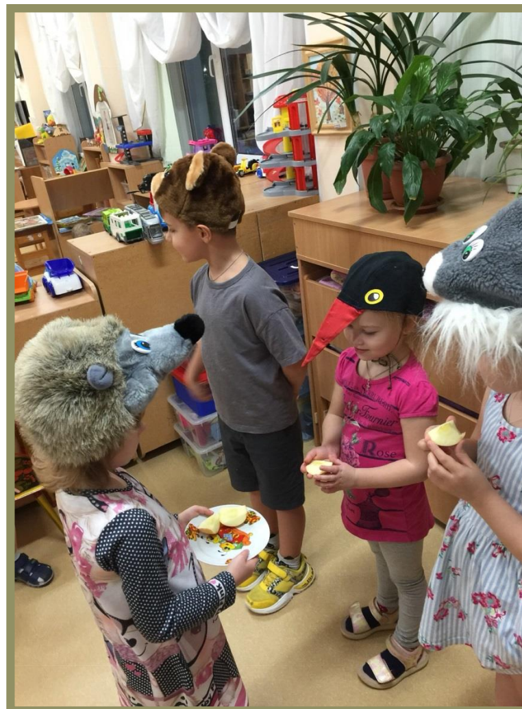
Игра-драматизация: В. Сутеева. «Яблоко»