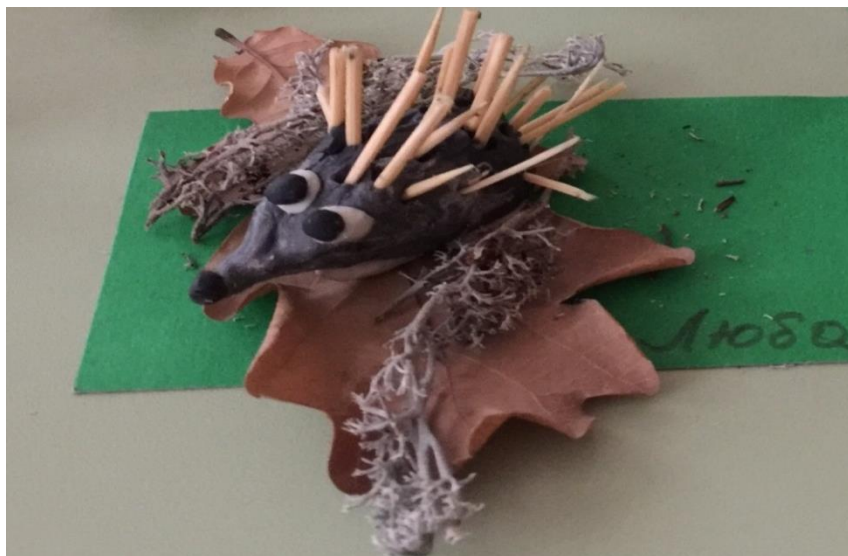
Лепка: «Вот ежик-ни головы, ни ножек»