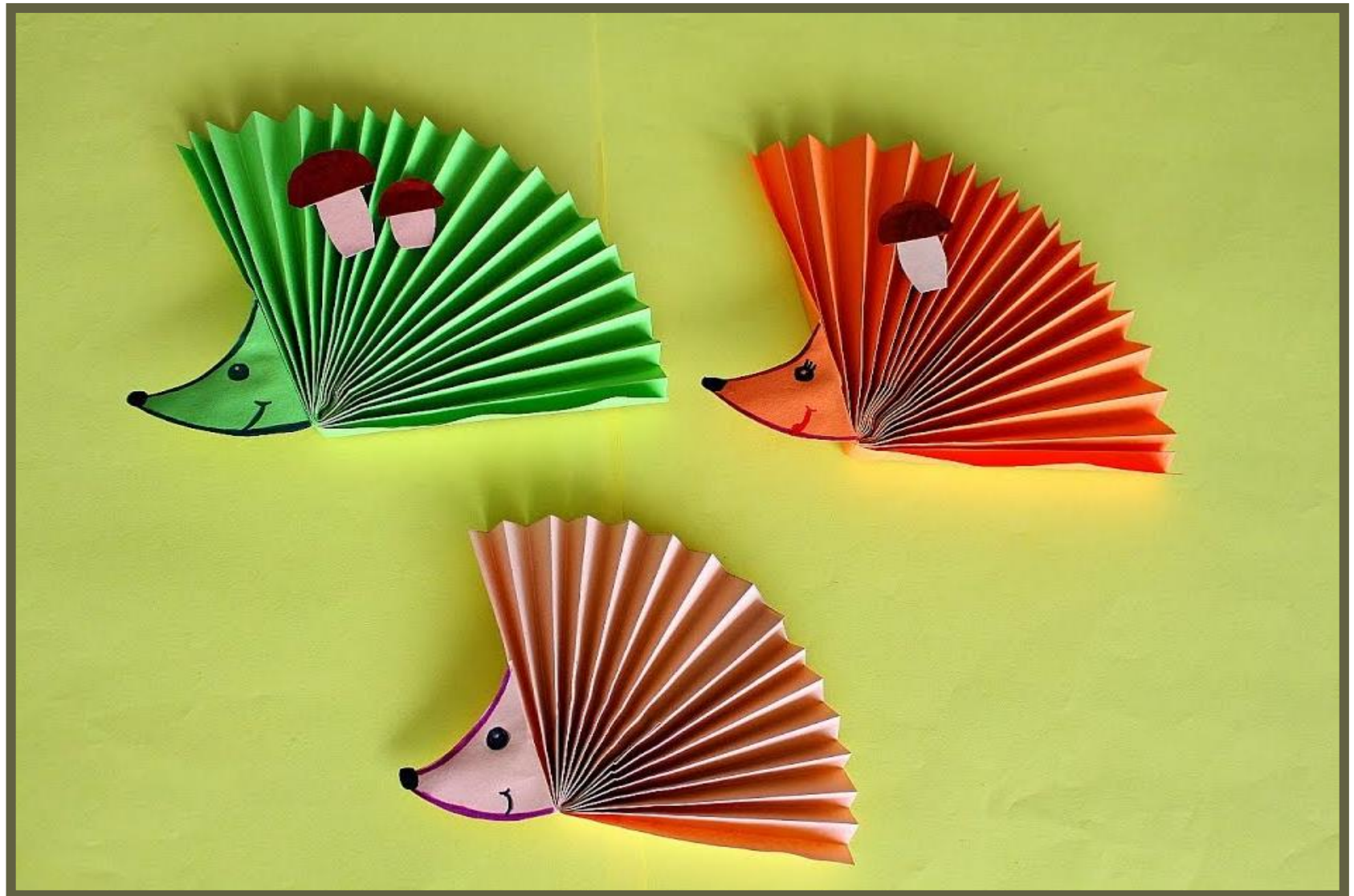
Конструирование в технике оригами: «Ежик»