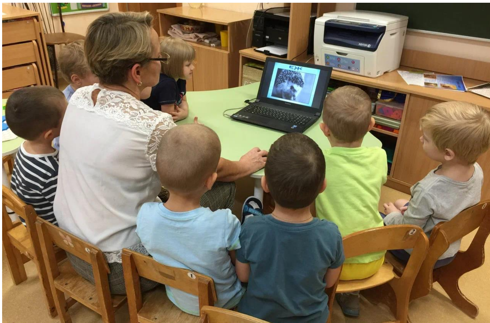
Презентация: « Зачем ежу иголки »