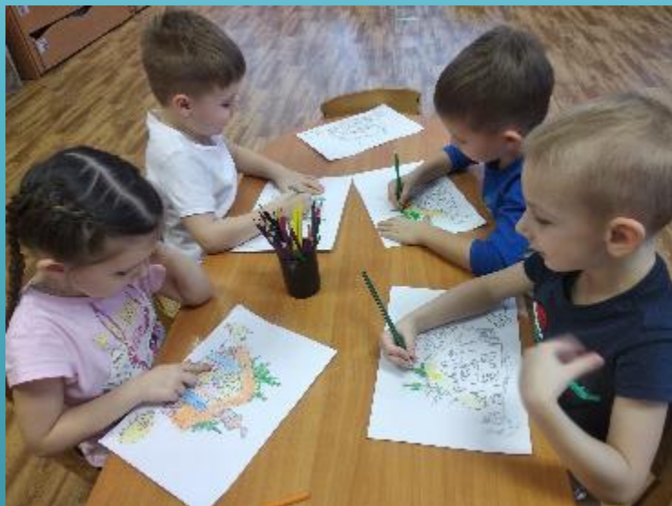
Раскраски по мотивам русской народной сказки «Зимовье зверей»