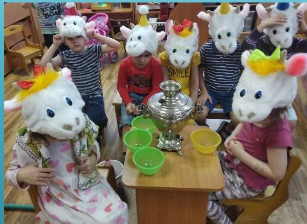
Игра-драматизация по мотивам русской народной сказки «Волк и семеро козлят»