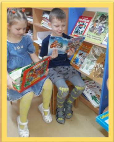
«Лиса и волк»