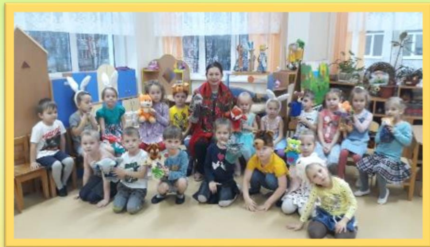
Игра-драматизация «Забывчивый медвежонок»