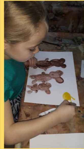
Рисование «Семья медведя»