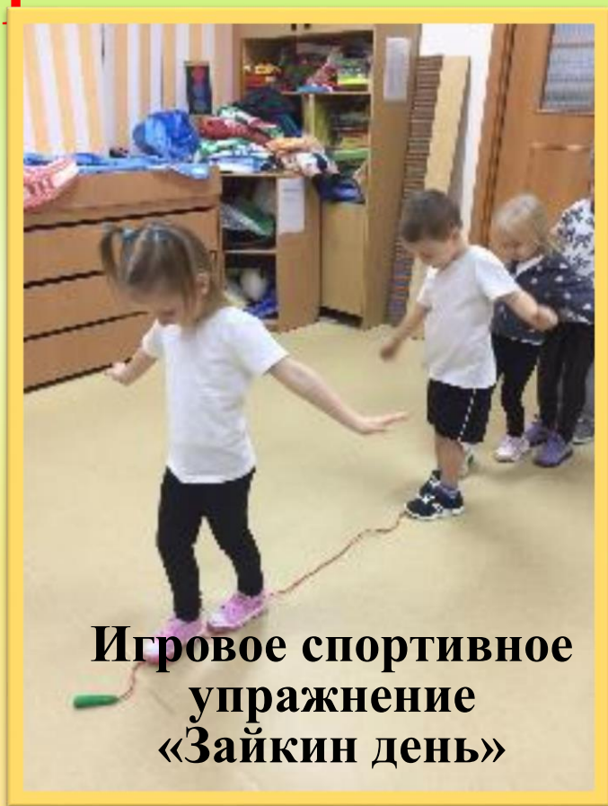
Игровое спортивное упражнение «Зайкин день»