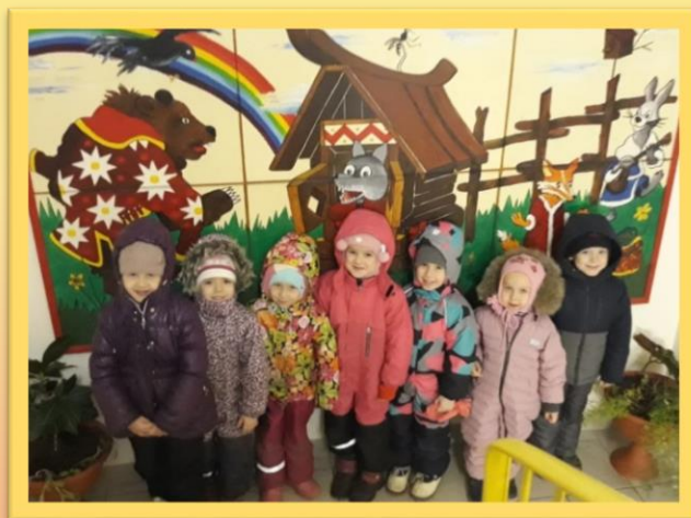
Рассматривание персонажей картины по русской народной сказке «Теремок»

У меня хитрющий носик И пушистый рыжий хвостик. Волку серому сестричка Я, красавица Лисичка!