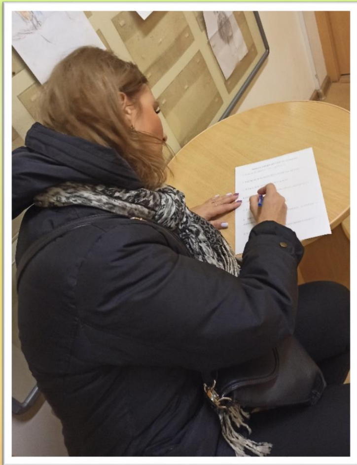
Анкета «Отношение ребенка к животным»