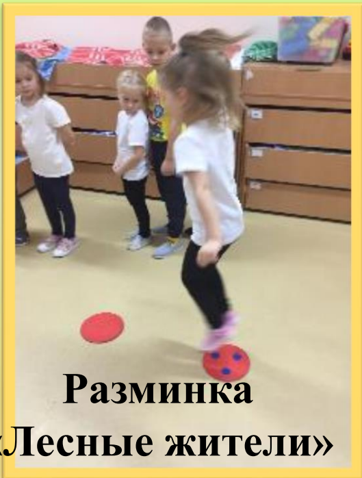
Разминка «Лесные жители»