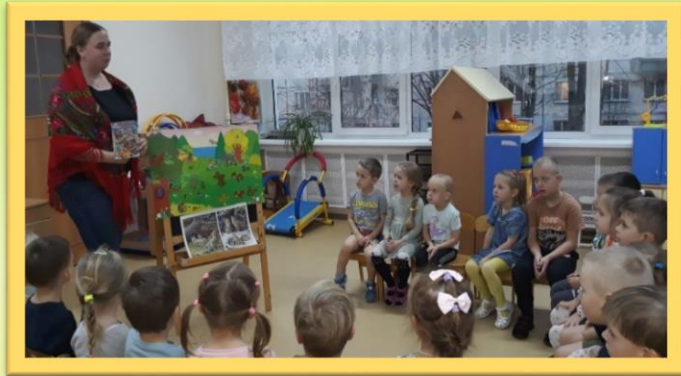
Беседа «Как животные готовятся к зиме»