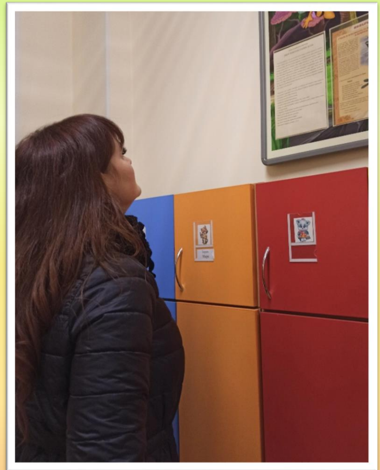
Консультация для родителей «Дикие животные наших лесов»