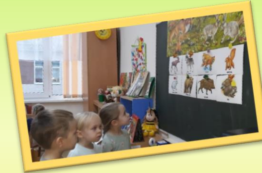
Рассматривание картин «Дикие животные»