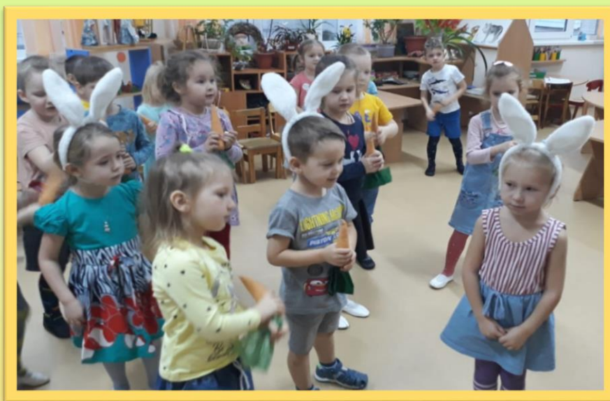
Танец «Зайка с морковкой»