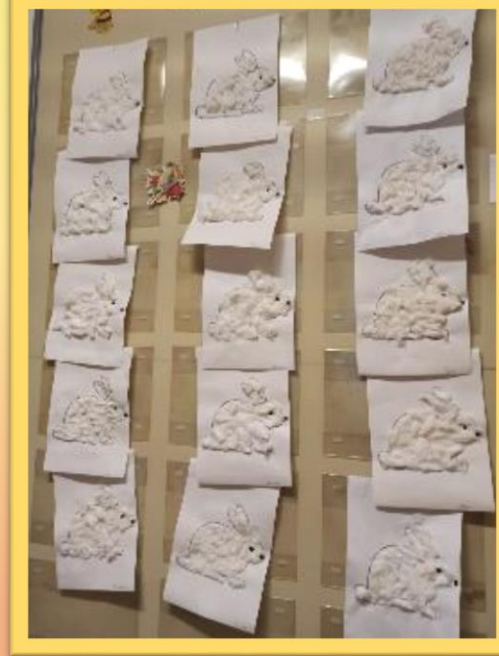
Аппликация «Зайчик в зимней шубке»