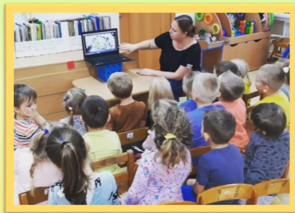
Просмотр презентации по мотивам В.Сутеева «Мешок яблок»