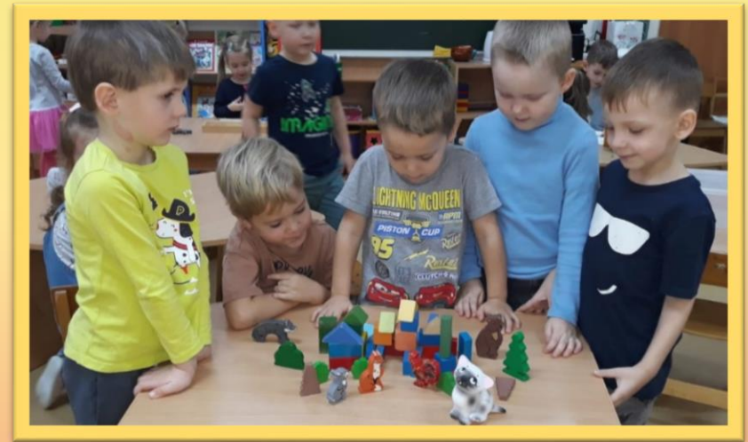
Конструирование «Строительство зоопарка»