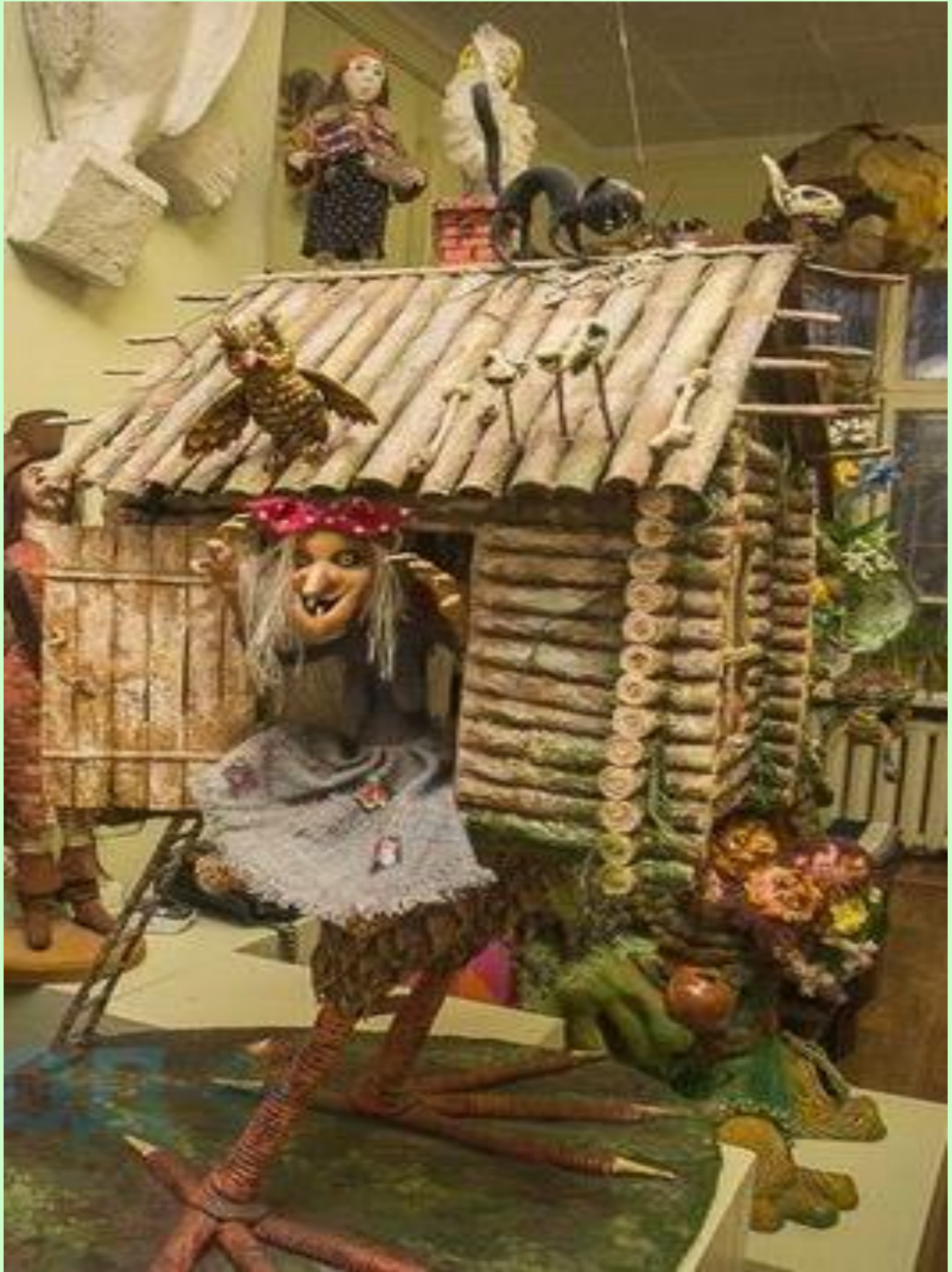
Дом Бабы-Яги сделан...из бумаги