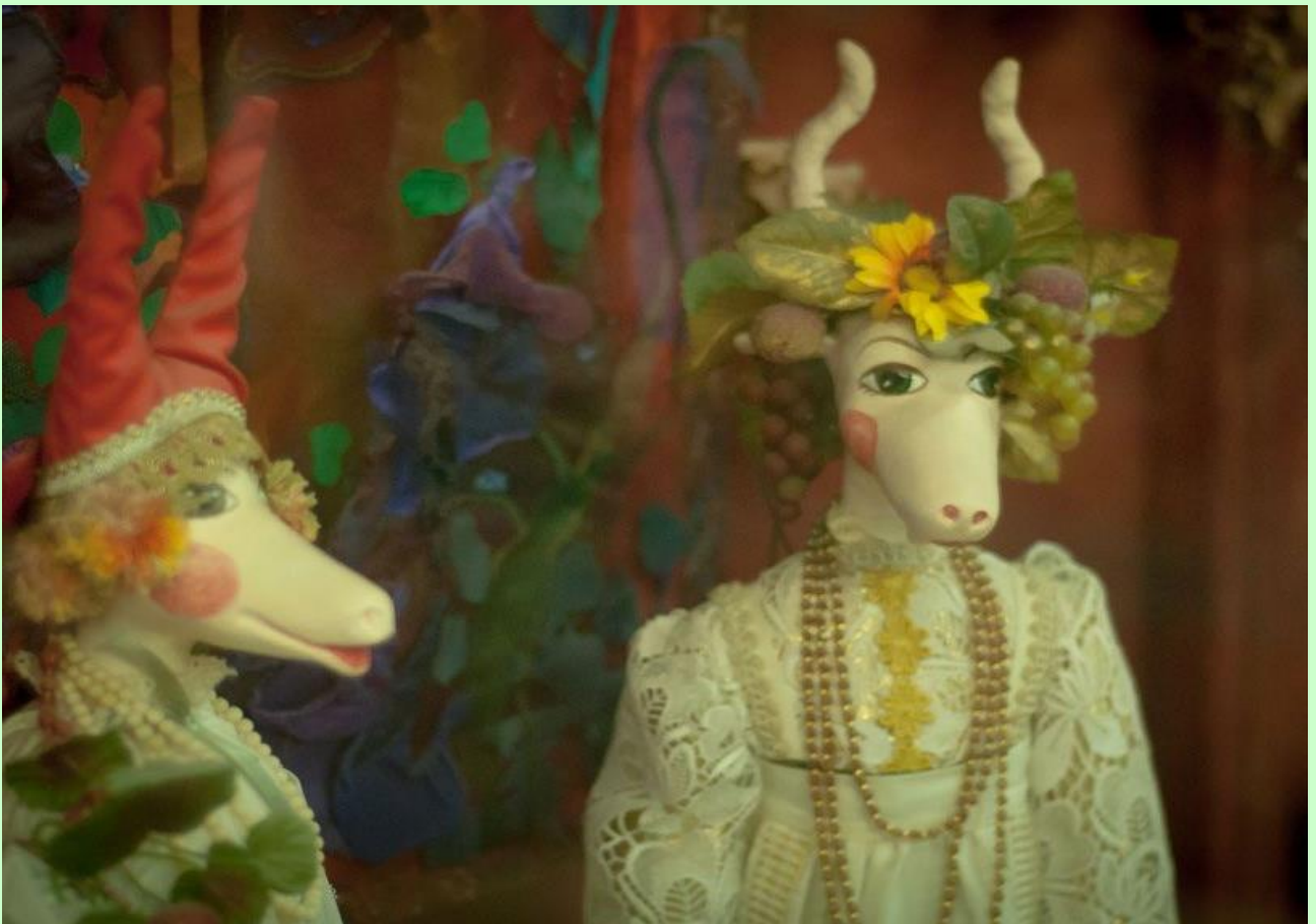
Козы - обрядовые куклы