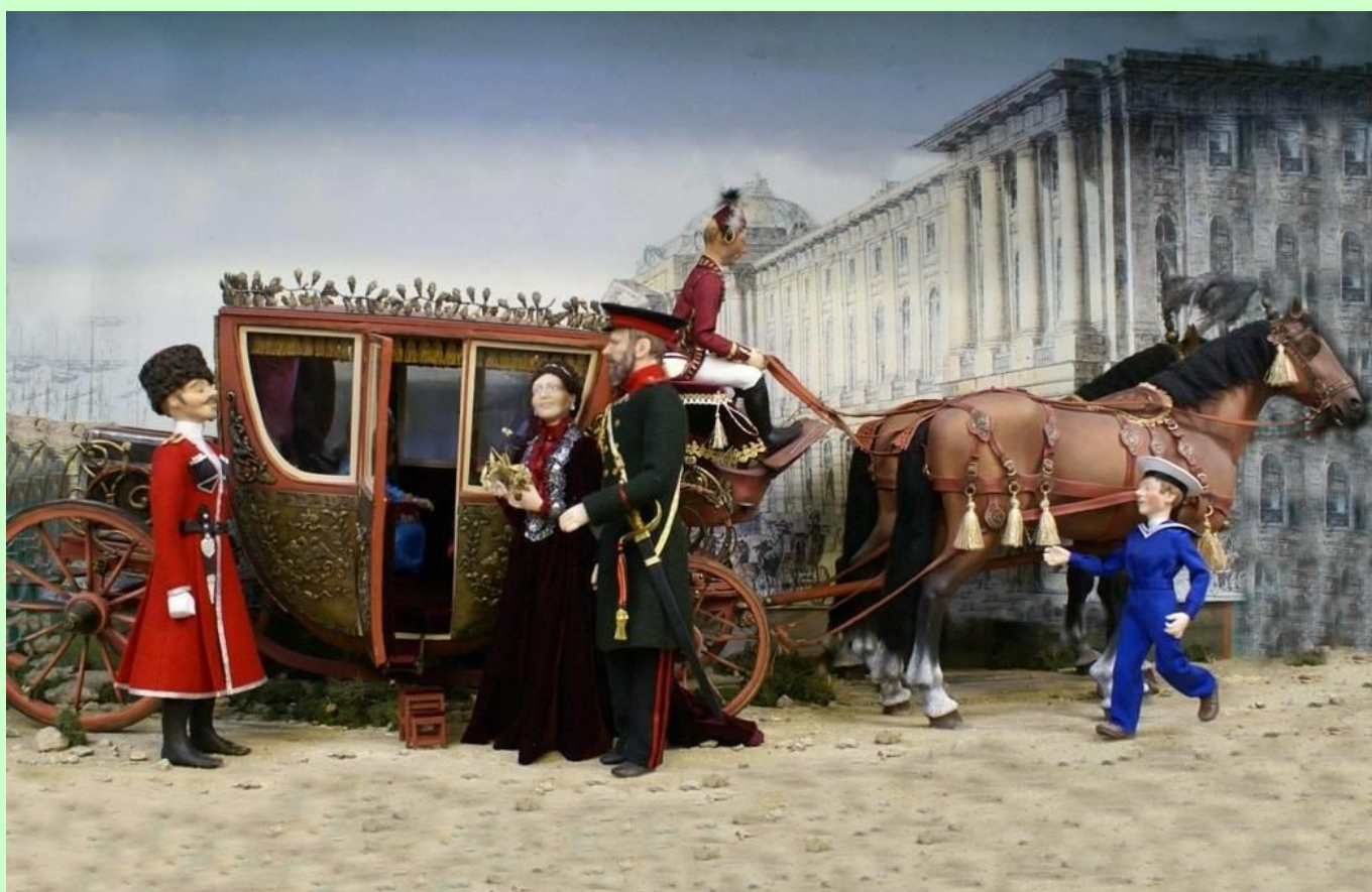
Царская семья Александра III на прогулке