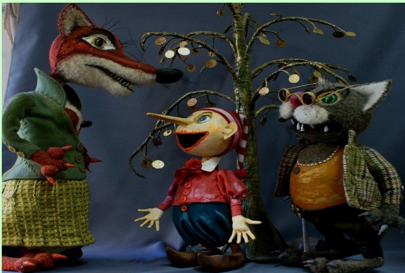
Буратино и его «друзья»