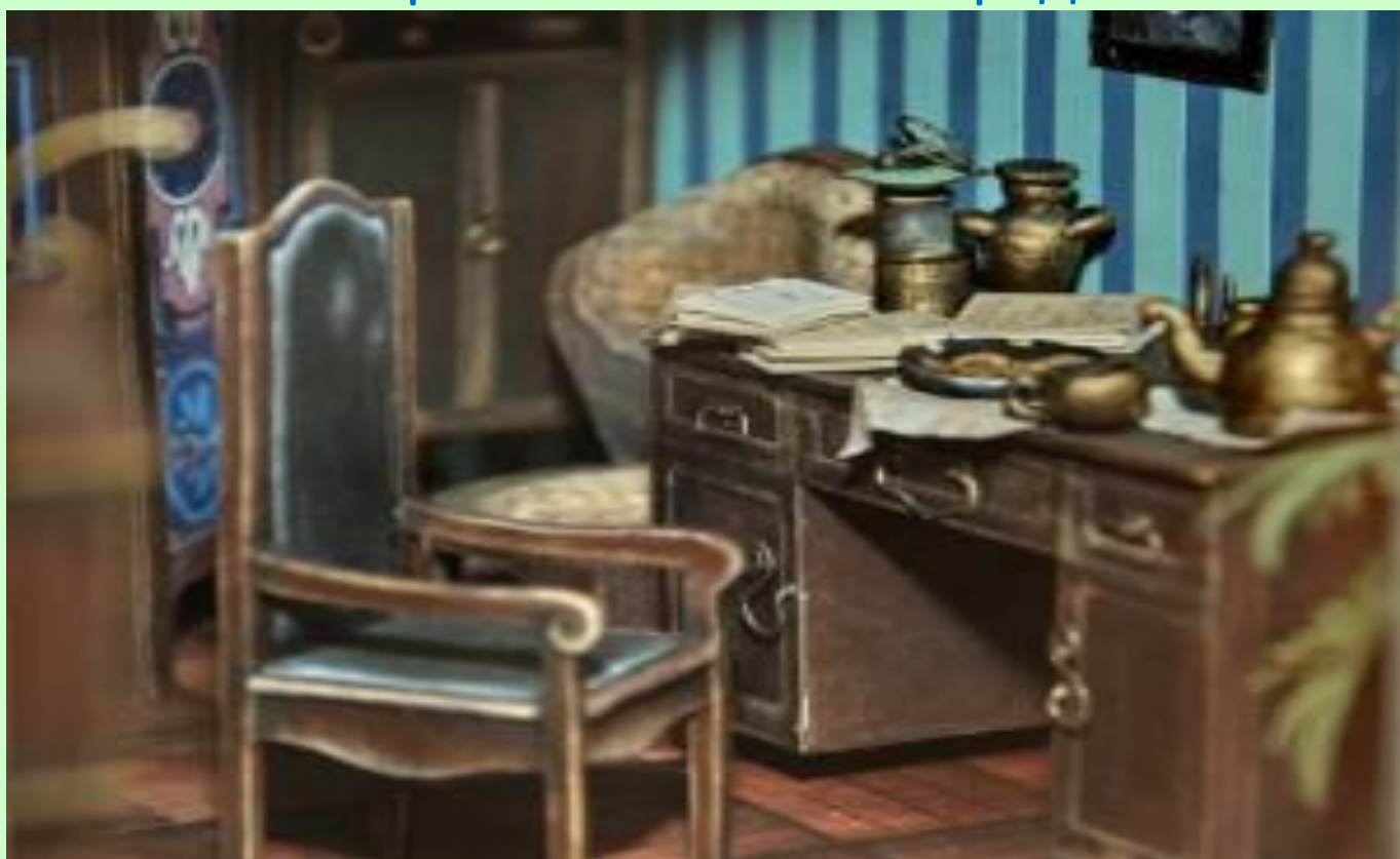
Интерьер кукольного дома