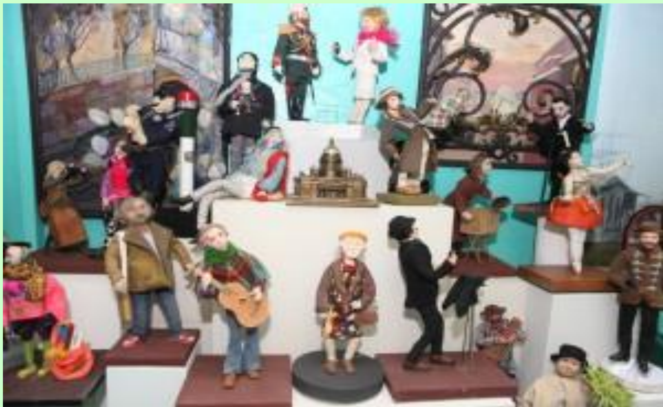
Современные жители города