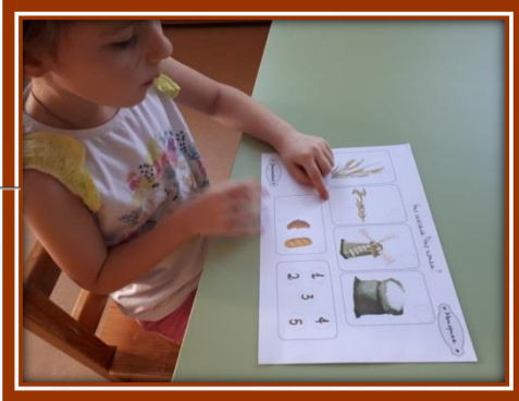
«Что сначала, что потом?»