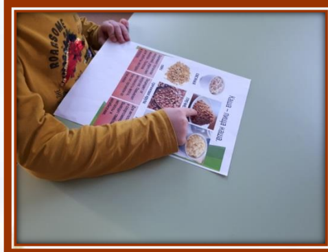
«Каша- пища наша»